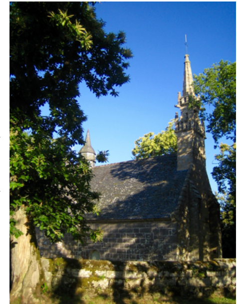
Chapelle des Sept-Saints.