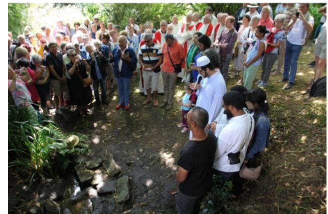
Lecture, à la fontaine, de la sourate des Gens de la Caverne.