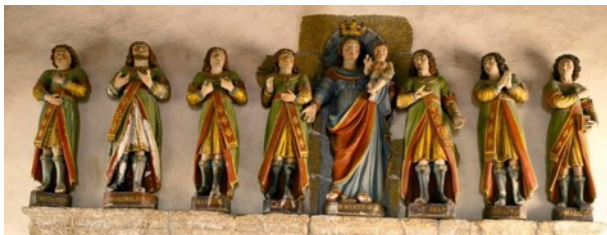
Les sept statues des Dormants d'Éphèse de la chapelle.